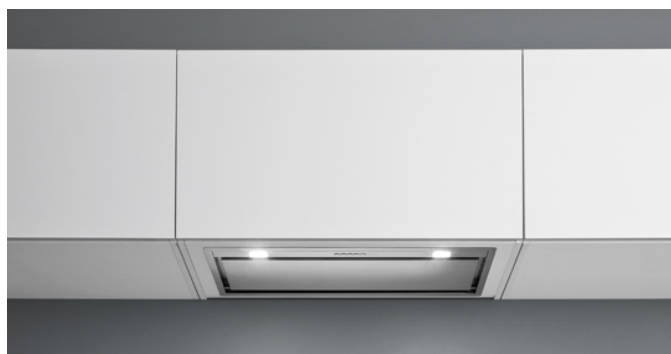
Fotografie je ilustrační. Nemusí odpovídat vybrané verzi.