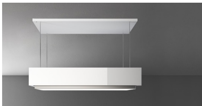
Fotografie je ilustrační. Nemusí odpovídat vybrané verzi.

Instalační typ Ostrůvkový Rozměry 120 cm Povrchová úprava Povrchová úprava z černého tvrzeného skla Motor 600 m 3 /h Typ ovládání Elektronické ovládání nastavení rychlosti 4 Osvětlení LED 50 W (2700K - 5500K) Uhlíkový filtr Carbon.Zeo náhradní filtrační sada pro odsavače Circle.Tech (obsahuje) Minimální vzdálenost Plynová varná deska: 65 cm Elektrická varná deska: 52 cm