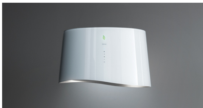
Fotografie je ilustrační. Nemusí odpovídat vybrané verzi.