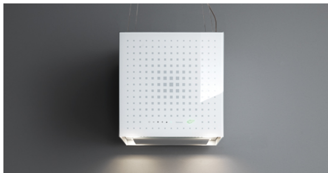
Fotografie je ilustrační. Nemusí odpovídat vybrané verzi.