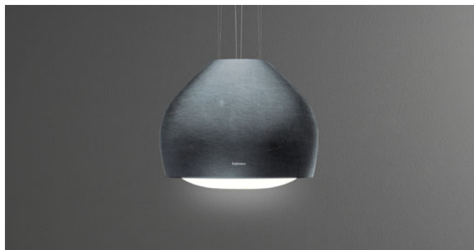
Fotografie je ilustrační. Nemusí odpovídat vybrané verzi.