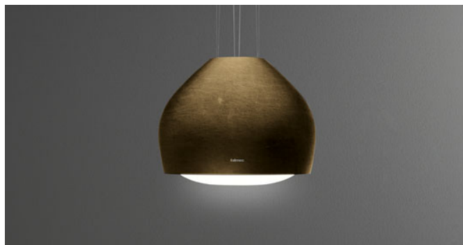
Fotografie je ilustrační. Nemusí odpovídat vybrané verzi.