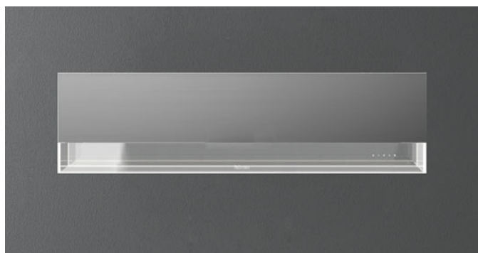
Fotografie je ilustrační. Nemusí odpovídat vybrané verzi.